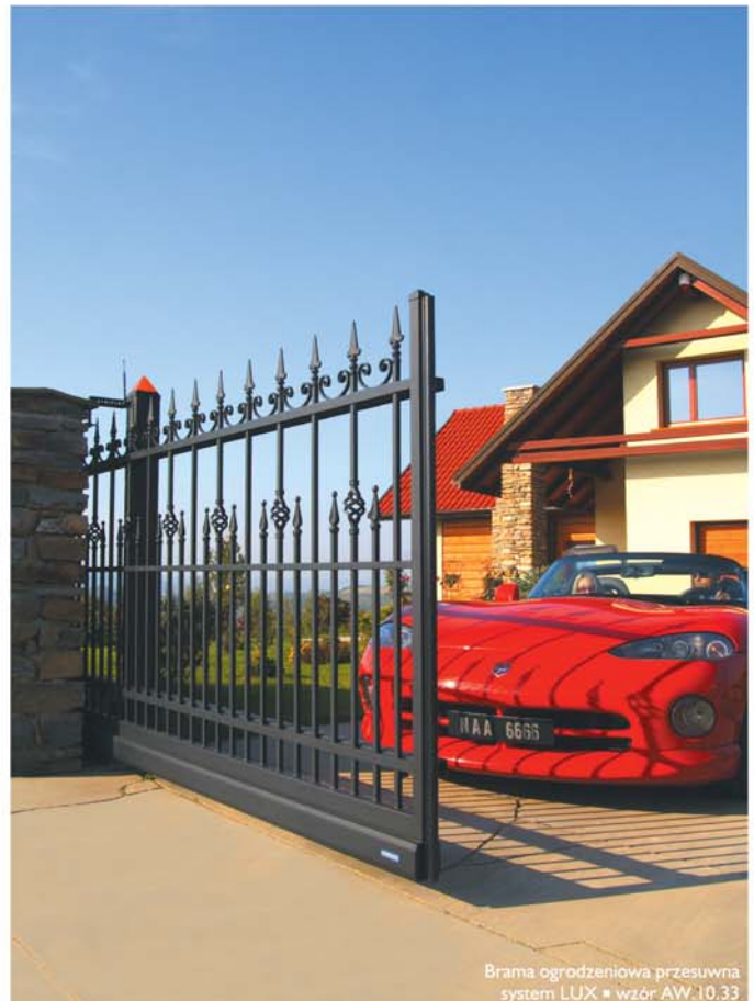
Brama ogrodzeniowa przesuwana system LUX ■ wzór AW.10.33