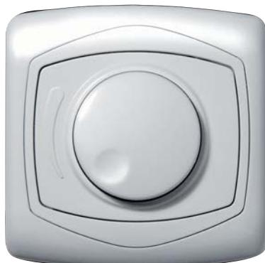
ściemniacz przyciskowo-obrotowy z serii TON