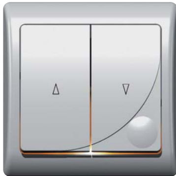
łącznik żaluzjowy z serii EFEKT