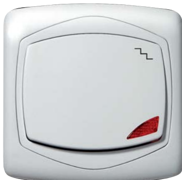
łącznik schodowy z serii TON